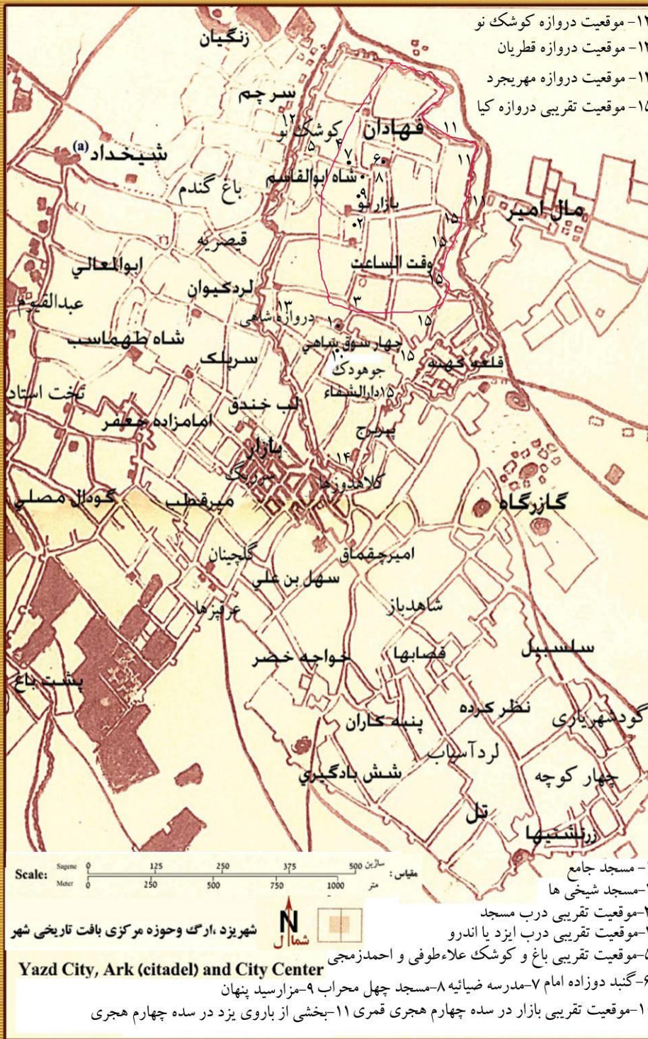
شکل ۳- موقعیت تقریبی شارستان و ریض یزد در سده‌های نخستین دوره‌ی اسلامی، جانمایی در نقشه‌ی تهیه شده توسط روسها در اواخر دوره‌ی قاجار (برگرفته از خادم‌زاده، ۱۳۸۶).