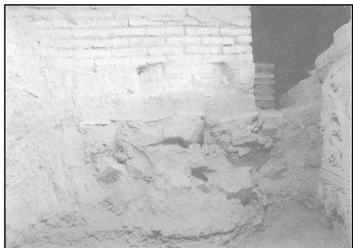
تصویر شماره ۱- بقایای کف مسجد جامع اصفهان از دوره خلافت عباسی (جعفری زند، ۱۳۸۱)

هجری، تعداد بسیاری از اهالی اصفهان به اسلام روی آورده‌اند. این زمان، مقارن با بازسازی گسترده مسجد جامع عتیق در سال ۲۲۶ق/ ۸۳۴م است که وسعت آن به حدود ۱۰ جریب می‌رسید (پیرنیا، ۱۳۶۹: ۱۳۵). وسعت ابعاد مسجد جامع، خود می‌تواند دلیل روشنی بر افزایش تعداد مسلمانان باشد (تصویر شماره ۱).