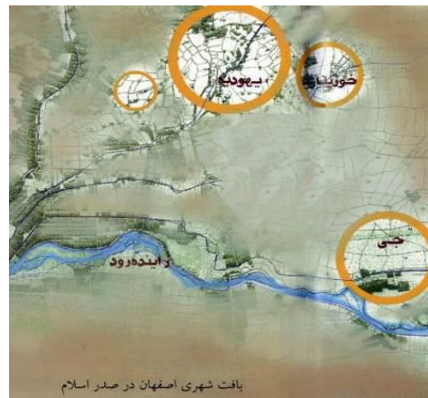
نقشه شماره ۱- بافت شهری اصفهان در صدر اسلام (تهیه: عمرانی، ۱۳۹۱)

بازسازی مسجد خُشینان و منبرنهادن در آن؛ توسعه شهر یهودیه (ابونعیم، ۱۳۷۷: ۱۲۹) (نقشه شماره ۱).