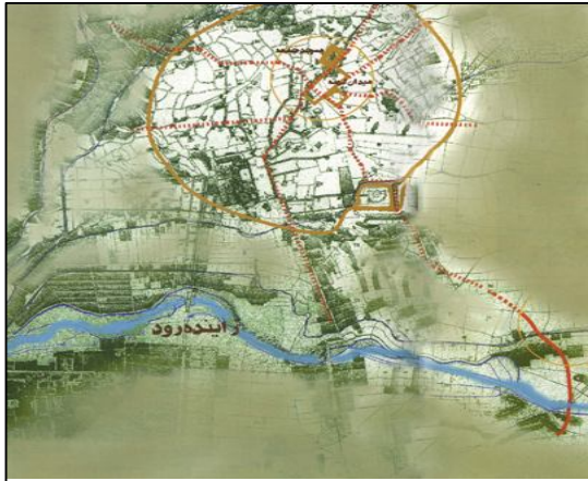
شماره ۲- بافت شهری اصفهان در دوره امرای آل بویه (تهیه: عمرانی: ۱۳۹۱)

از پلان مسجد جرجیر در زمان آل‌بویه، اطلاعات اندکی در دست داریم؛ اما قرارگیری این مسجد در بافت شهر تامل‌برانگیز است. باتوجه به مکان‌یابی تقریبی دروازه‌های آل‌بویه و سلجوقی، می‌توان این‌طور استنباط کرد که مسجد جامع جرجیر در نقشه