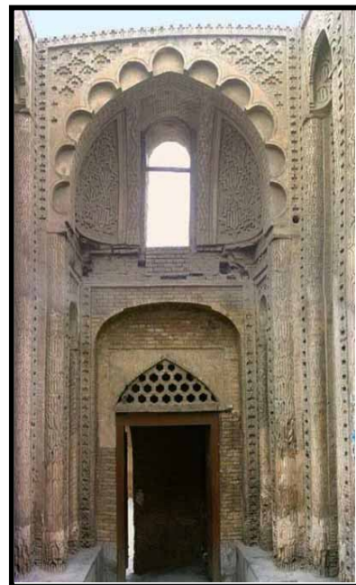
تصویر شماره ۲- نمای سردر ورودی مسجد جامع جرجیر (گلابی: ۱۳۹۱)

تنها اثر باقیمانده در این، بنا سردر آجرکاری شده معروف به «سردر جرجیر» است که از مهم‌ترین آثار تزئینی معماری آل‌بویه محسوب می‌شود (تصویر شماره ۲). این تزئینات شامل کتیبه‌ای به خط کوفی مشجر است که تنها آیاتی از «بسم‌الله‌الرحمن‌الرحیم» و «بالقسط لا اله الا هو العزیز الحکیم» از آن باقی مانده است. نقوش تزئینی این سردر نیز شامل فنون آجرکاری و گچبری با نقوش هندسی و گیاهی است (سرفراز، ۱۳۹۱: ۵).