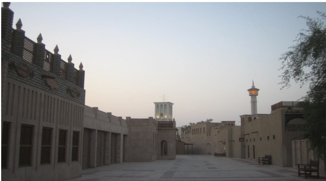
عکس شماره ۵: محله بستکیه پس از بازسازی توسط حکومت دبی (۱)