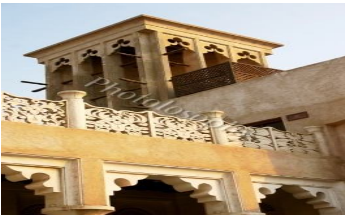
عکس شماره ۴: بادگیرخانه های بستکیه (۲)