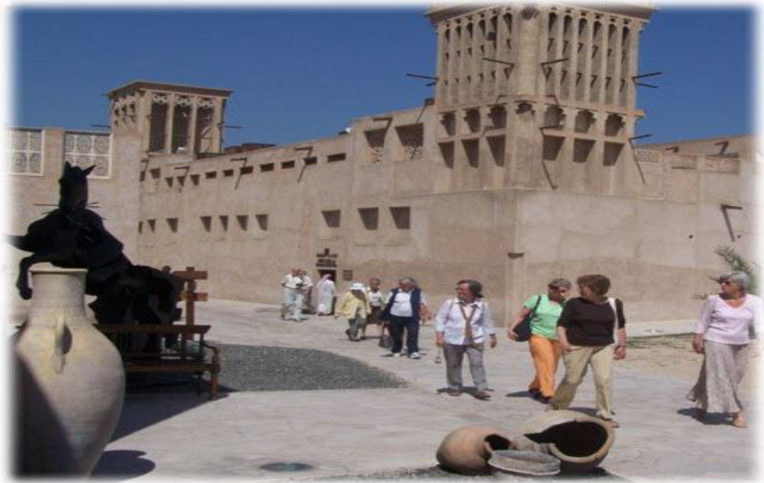
عکس شماره ۷: بازدید توریست‌ها از محله البستکیه