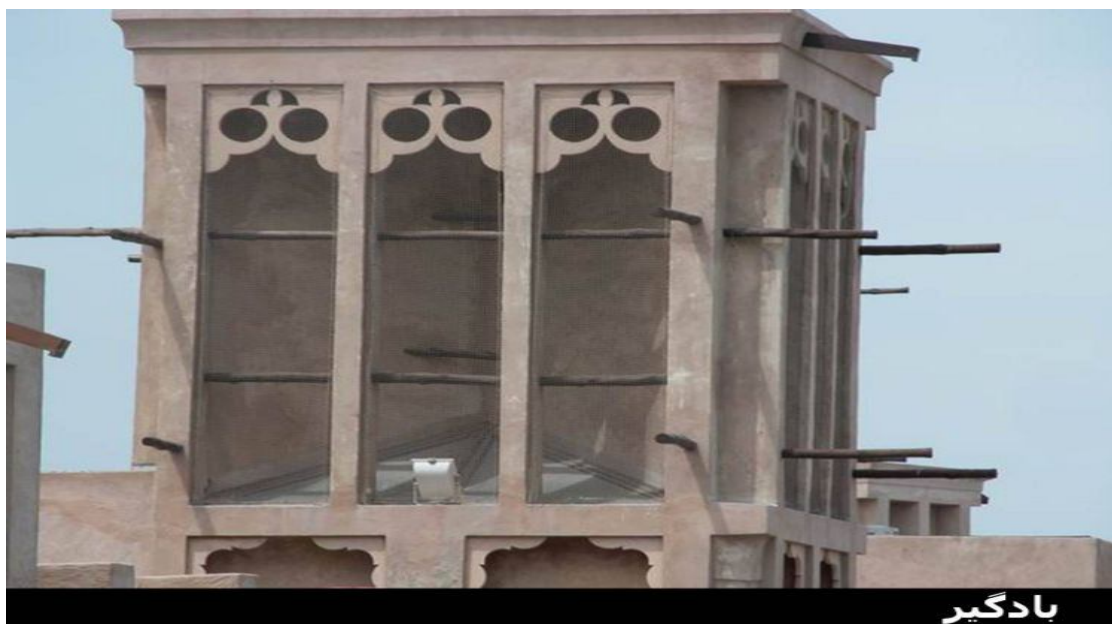
عکس شماره ۳: نمونه ای از بادگیرهای خانه های محله بسکیه (۱)