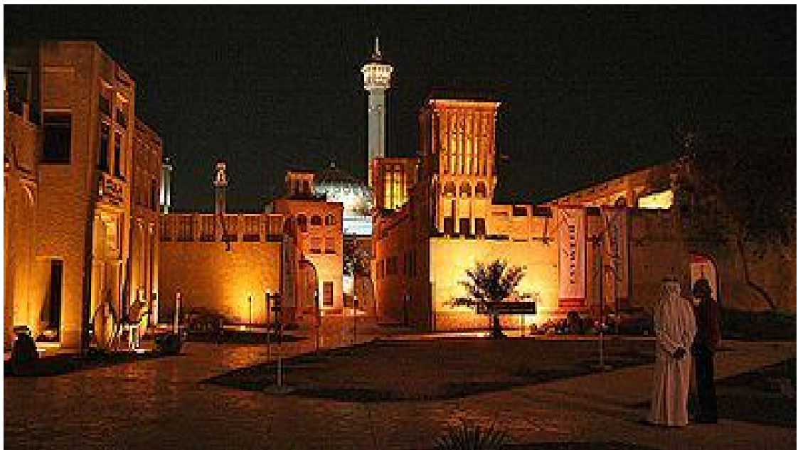
عکس شماره ۸: نمایی از مرکز البستکیه در شب